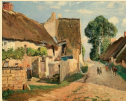
Камиль Писсаро Хижины в Овер-сюр-Уаз, 1873

В экспозиции представлена серия картин, тщательно отобранных из 50-ти частных коллекций со всего мира, которая рассказывает историю импрессионизма от начала до конца. Вначале посетители ознакомятся с предшественниками этого течения: Коро, Йонгкиндом и Эженом Буденом. Затем увидят живопись 1870-х годов, включая десяток картин различных периодов творчества Моне, Писсаро, Моризо и т. д., а затем полотна переломных 80-90-х годов – время формирования характерных особенностей каждого из импрессионистов. На выставке также освещены наиболее заметные этапы творчества художников, раздвинувших границы этого течения. Например,