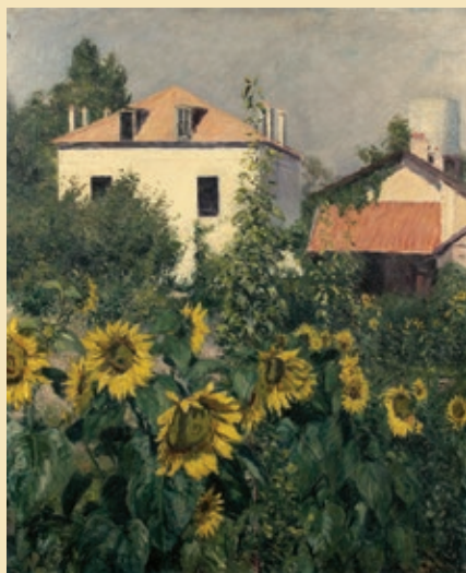
Гюстав Кайботт Подсолнухи в Пёти-Женвилье, 1885

Государственный деятель Жюль Мармоттан, любивший искусство и собравший серьезную коллекцию времен Средних веков и Возрождения, приобрел в 1882 году роскошный охотничий дом, расположенный невдалеке от Булонского леса. Его сын Поль был таким же страстным коллекционером, как и его отец, но особое внимание уделял временам Первой Империи. И особенно, и все коллекции Поль Мармоттан завещал Художественной Академии. В 1934 году здесь был открыт музей, рассказывающий об эпохе Наполеона Бонапарта. Но в 1957 году сюда поступило собрание картин Ж. де Бельо, врача, у которого лечились многие художники-импрессионисты, расплачивавшиеся с ним картинами, а в 1966 году музею досталась коллекция Клода Моне. Так музей стал местом хранения самого крупного собрания картин основателя импрессионизма, и все чаще его стали называть Мармоттан-Моне. Здесь находится и картина, которая дала название всему художественному течению: «Impression. Soleil levant» (Впечатление от восхода солнца).