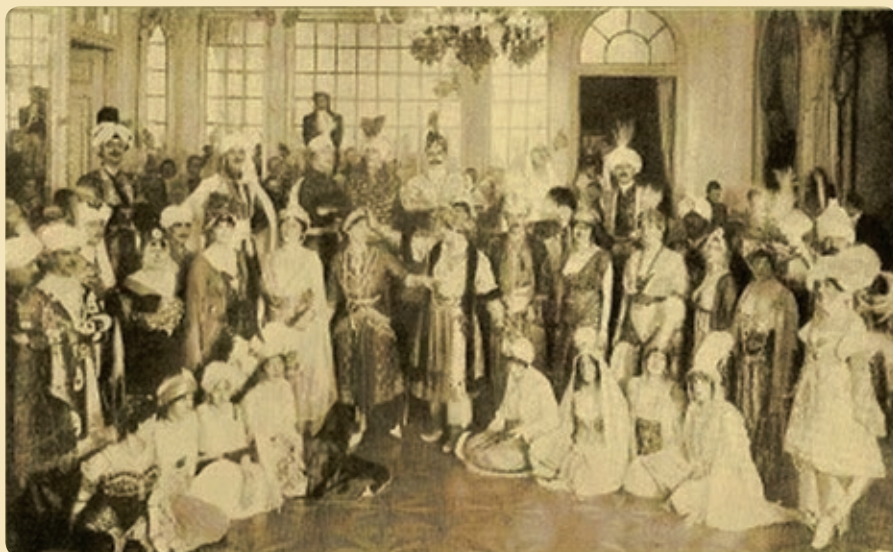
Костюмированный бал. Фото из журнала «Столицы и усадьба», 1914 год