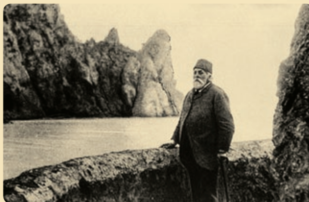
Князь Л.С. Голицын в Новом Свете, 1910 год

Начиная с 2000 года многие российские винодельческие компании-производители выпускают вина, ни в чем не уступающие, а порой и превосходящие по качеству европейские аналоги. Среди этих компаний лидирует уникальное хозяйство «Лефкадия», созданное в 2004 году на живописных склонах в предгорьях Кавказского хребта.