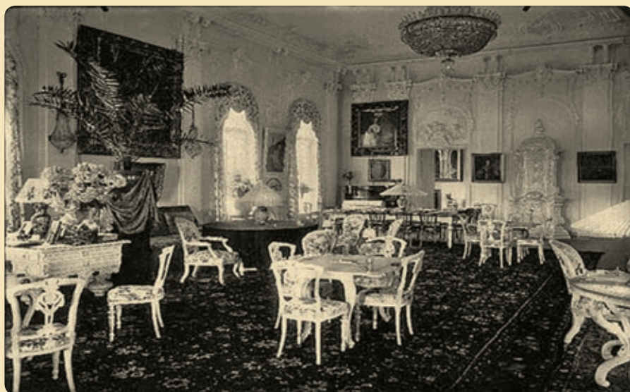
Интерьеры дачи.

В 2007 году была проведена новая серия реконструкций, в процессе которой дачу Клейнмихель восстановили в первоначальном виде, а дачу Чинизелли отстроили заново. Сейчас особняк, больше похожий на дворец из волшебной сказки, именуется Домом приемов, теперь это Управление делами Президента РФ.