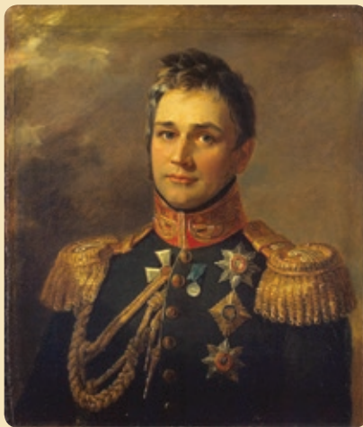
Портрет графа М.С. Воронцова работы Джорджа Доу 1825 год Государственный Эрмитаж

Виноградарство стремительно развивалось не только на Дону, но и на новых территориях, осваиваемых казаками. Крым стал частью Российской Империи еще при Екатерине Великой, и постепенно превратился в курорт для российских аристократов, благодаря своему мягкому Средиземноморскому климату. В 20-е годы XIX века граф Михаил Семенович Воронцов, ценитель тонких европейских вин, построил в Алушке винодельческий завод, а неподалеку, в Магарыче, основал Институт вина, который до сих пор остается ведущим в нашей стране. Недалеко от Новороссийска агроном Фридрих Гейдук обнаружил поразительный участок земли, где почва и климат были удивительно похожи на французскую провинцию Шампань. Это место впоследствии назовут Абрау-Дюрсо, оно станет главным центром изготовления знаменитого игристого вина в России – шампанского отечественного производства. Тогда же стали появляться первые винные мошенники, которые изготавливали низкокачественные вина с содержанием различных химических добавок и ароматизаторов.