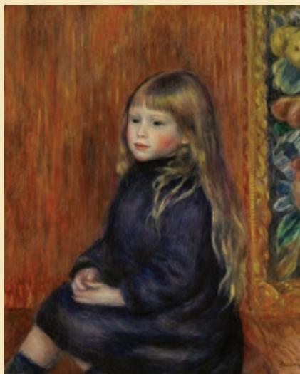
Пьер-Огюст Ренуар Сидящая девочка в синем платье, 1889