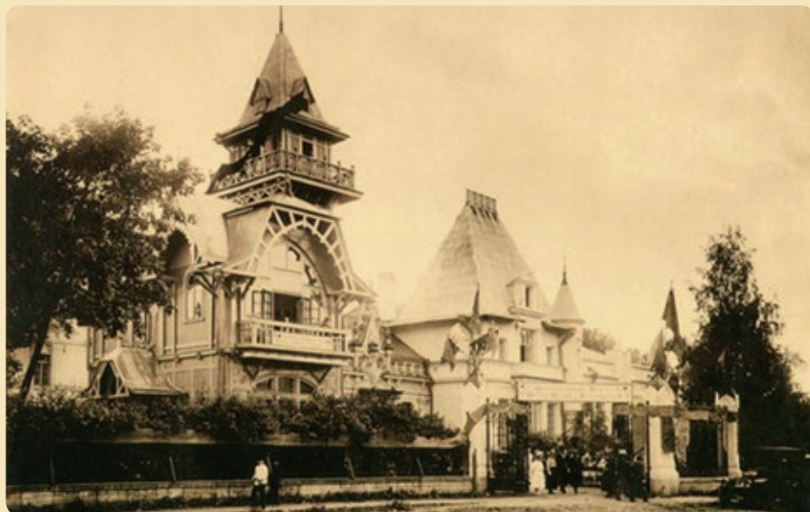
Дача Клейнмихель-Чинизелли. Фото В.Я. Штейнберга, 1920 год

билей, ее «Форд» не раз выигрывал первые места на автоконкурсах.