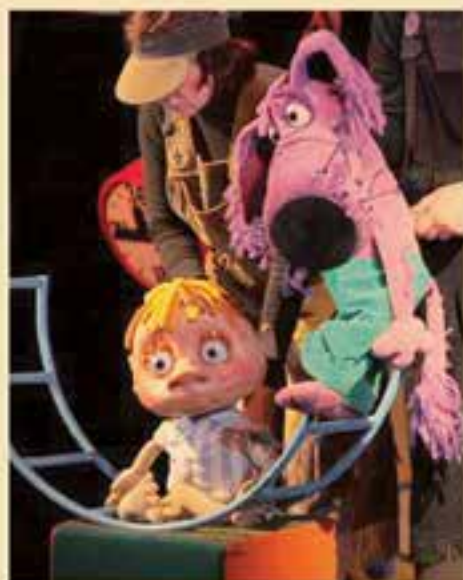
Большой Театр Куклы спектакль: «Посе идите и колемане»

После войны театр ставит не только детские спектакли, но и спектакли для взрослых. Так, в конце 50-х Большой театр кукол показал своим зрителям постановку по произведениям Ильфа и Петрова, а также спектакль «1002-ая ночь» Н. Гернет и К. Шнейдер.