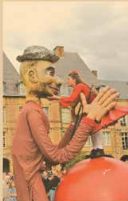
Площадь Жака Феликса, г. Шарлевиль

В 1981 году в городе был открыт Международный Институт Кукольного Искусства (Institut International de la marionette). Институт включает в себя научно-исследовательский и издательский центр, школу (Ecole Supérieure Nationale des Arts de la Marionnette – E.S.N.A.M., основную в 1987 году), а также видеоархив и библиотеку, в распоряжении студентов театральные площадки и выставочные залы.