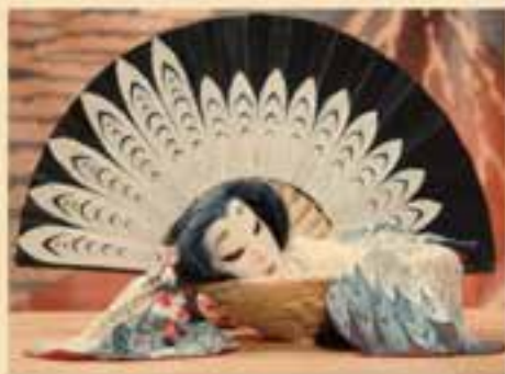
Государственный театр марионеток им. Е.С. Деммени: спектакль «Вальшное перышко»