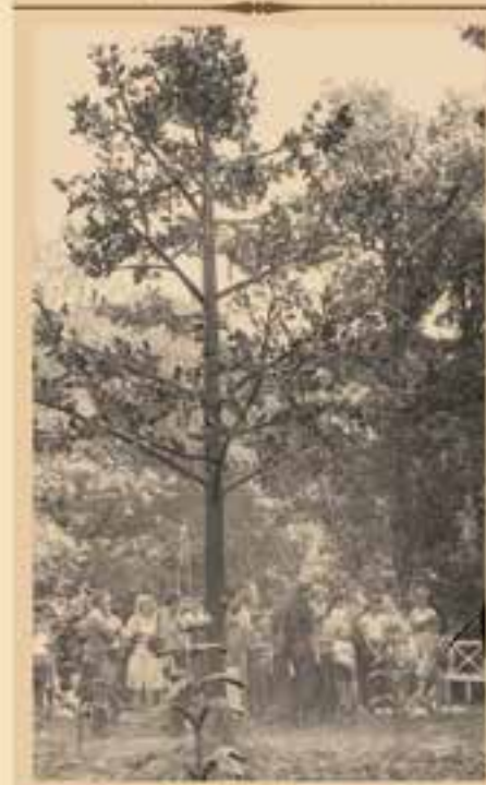
Петергоф. Фейерверк «Дубок»

Гостей замка Орсини, забредших в «Сад Монстров» чуть ли не под каждым кустом ждало какое-нибудь чудовище, мифологический герой или экзотическое животное. «Врата преисподней», «Храм вечности», «Падающий дом», а так же статуи слонов, пегасов, фурий, драконов, черепах, сирен, гигантов и античных богов и героев — всё это можно встретить в парке и сейчас: после нескольких столетий забвения и запустения парк был восстановлен силами приобретшего его семейства Беттини, Института истории и архитектуры Рима и Французской академии в Риме. В парке бывал даже Сальвадор Дали —