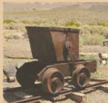
Узлы для вагонов и рельсы (прототип аттракциона «Американские горки»), «Долина Смерти», США.

ствования Петра I и Екатерины II научились делать действительно захватывающими. Говорят, что русские ледяные горы могли достигать в высоту 25 метров и иметь уклон до 50 градусов. Такие горы обыкновенно строились на ярмарках и праздниках,