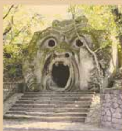
«Il Giardino dei Mostri» (Сад Монстров)