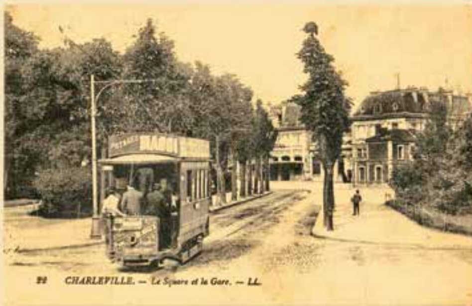
Шарлеви́ль. — Le Square et la Gare. — LL.